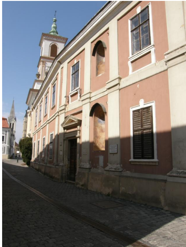
A piarista templom és rendház