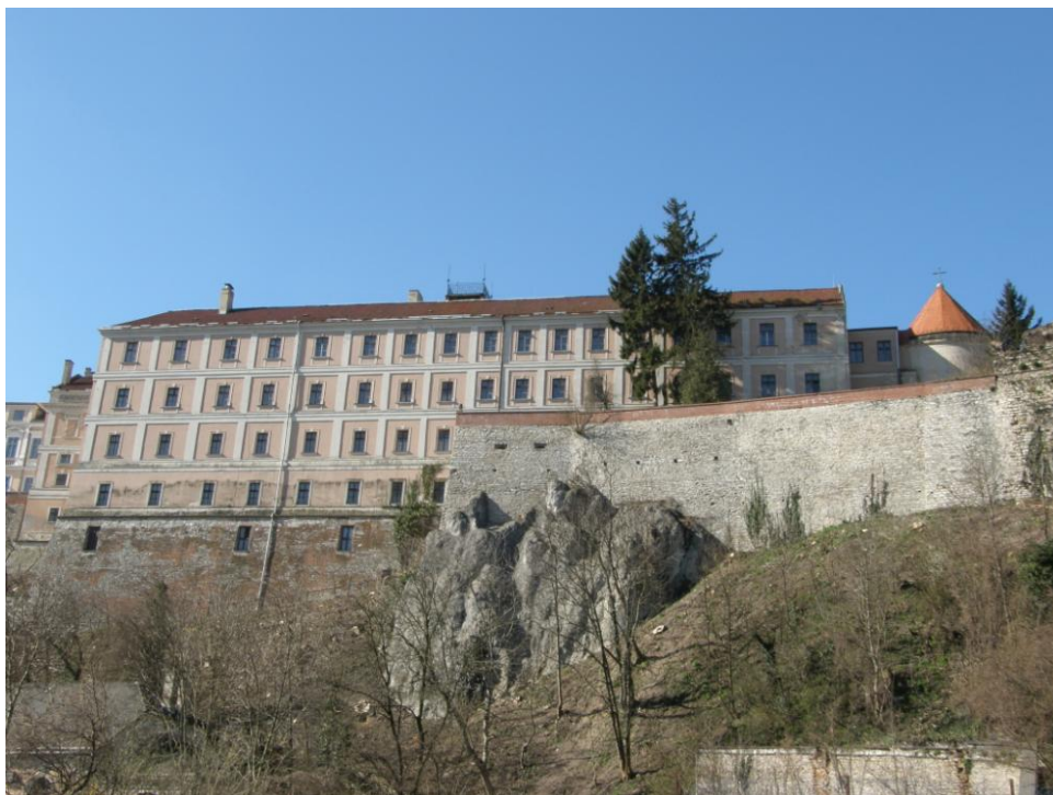
A Veszprémi Piarista Gimnázium főépülete (a szerző felvételei)