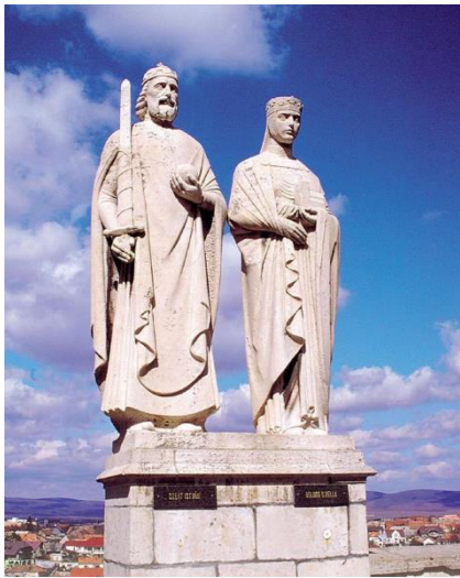
Szent István és Boldog Gizella Ispánki József szobra