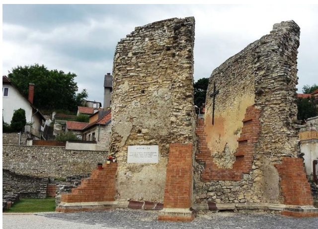
Alexandriai Szent Katalin Kolostor és templom romjai

2. A Htv. 1. § (1) bekezdés j) pontjának való megfelelést valószínűsítő dokumentumok, támogató és ajánló levelek: -----