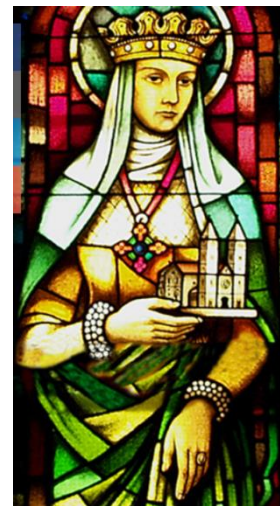
Boldog Ilona és Árpád-házi Szent Margit a Szent Mihály-bazilika üvegablakain