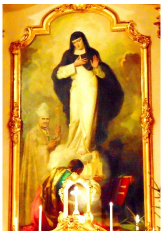
Árpád-házi Szent Erzsébet-templom Krusnyák Károly oltárképe