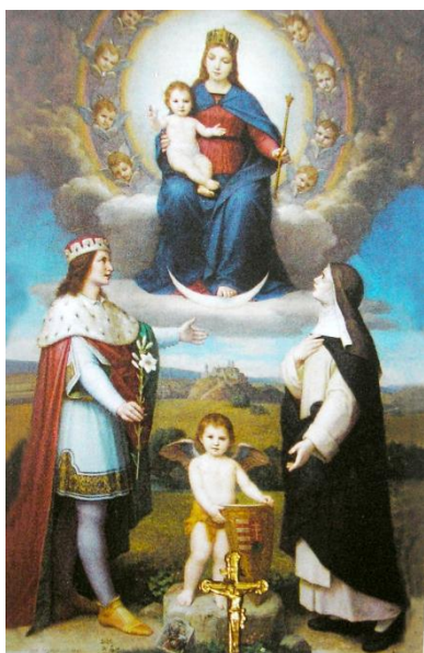
Szent Imre és Boldog Margit Veszprémi Érsekség kápolna