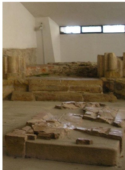
Szent György-kápolna – oltárhoz vezető lépcsők