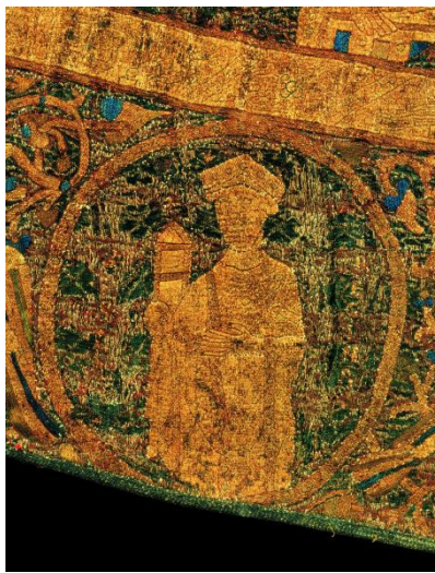
Boldog Gizella királyné a koronázási paláston