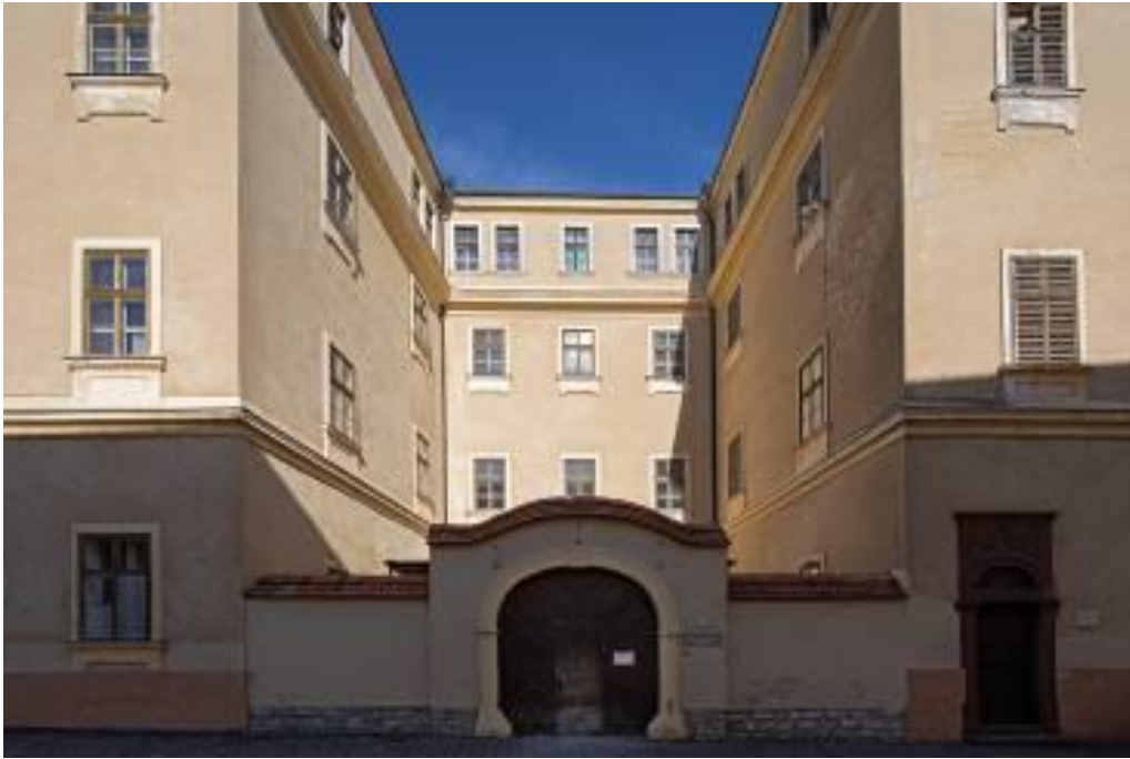
Vár utca 21. Az egykori Agg papok háza, majd Kísszeminárium: