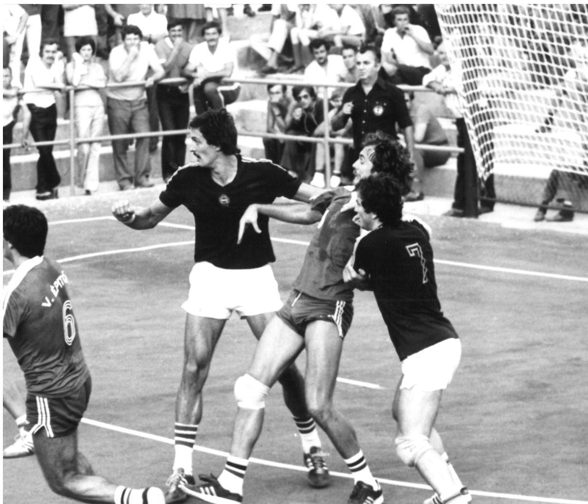
A magyar válogatott is volt vendége az Építőknek egy nyári tornán a pályaavatón