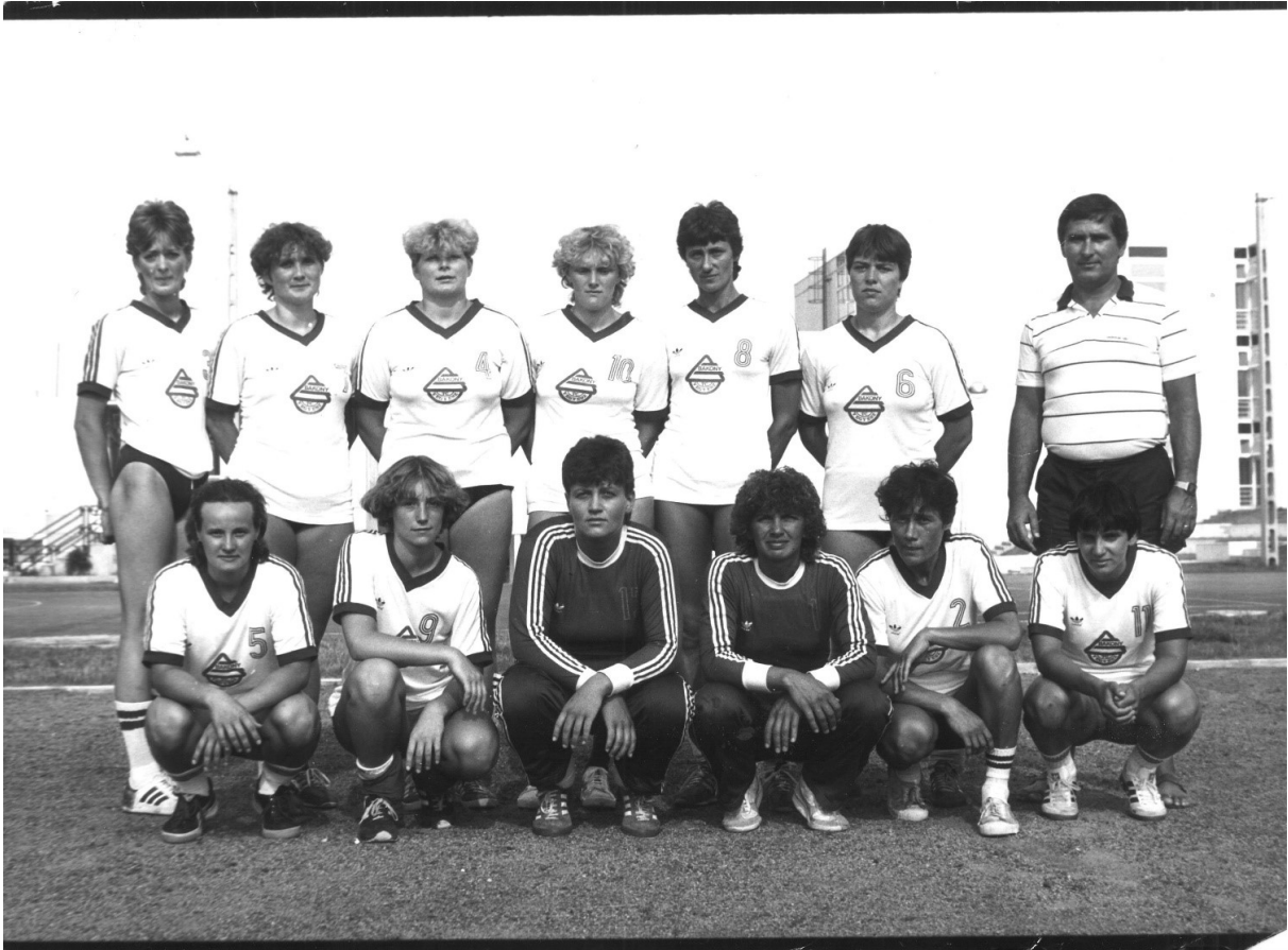
A női együttes a nyolcvanas évek elején meghatározó együttese volt az élvonalnak