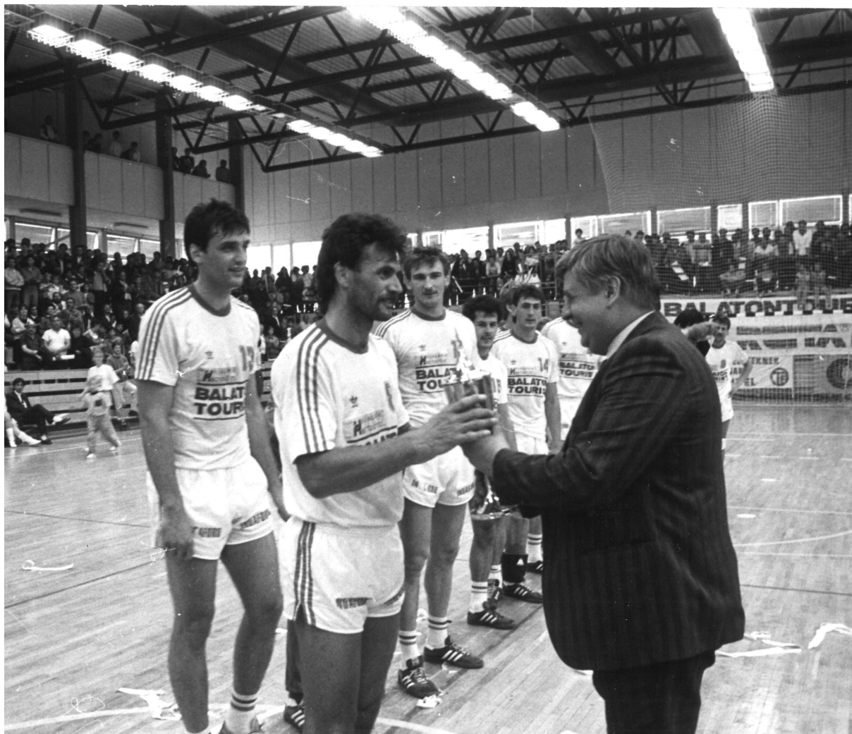
Magyar Kupa győztes az Építők, már a Március 15. utcai csarnokban