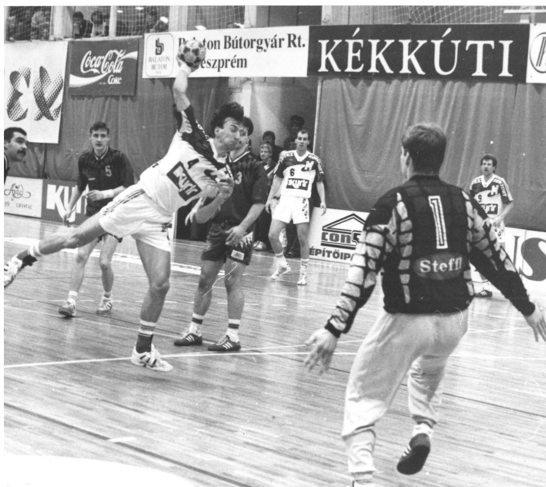
A férfi csapat a kis csarnokban is rengeteg sikert aratott nemzetközi kupa mérkőzéseken