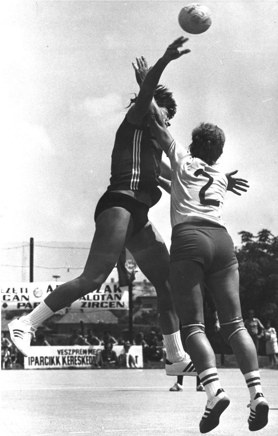
A Kádár utcai pályán nyaranta rendezték meg a Balaton Bajnokság, vagy a Napló Kupa nemzetközi tornákat