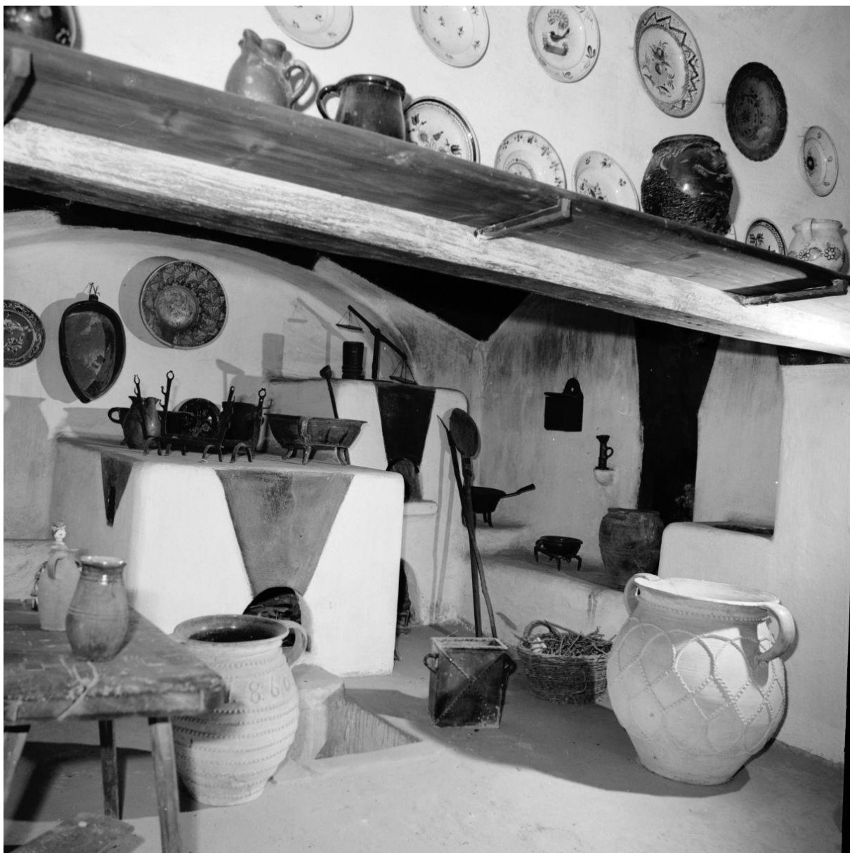
LDM_Fotótár_70.5493 A Bakonyi ház konyha 1937