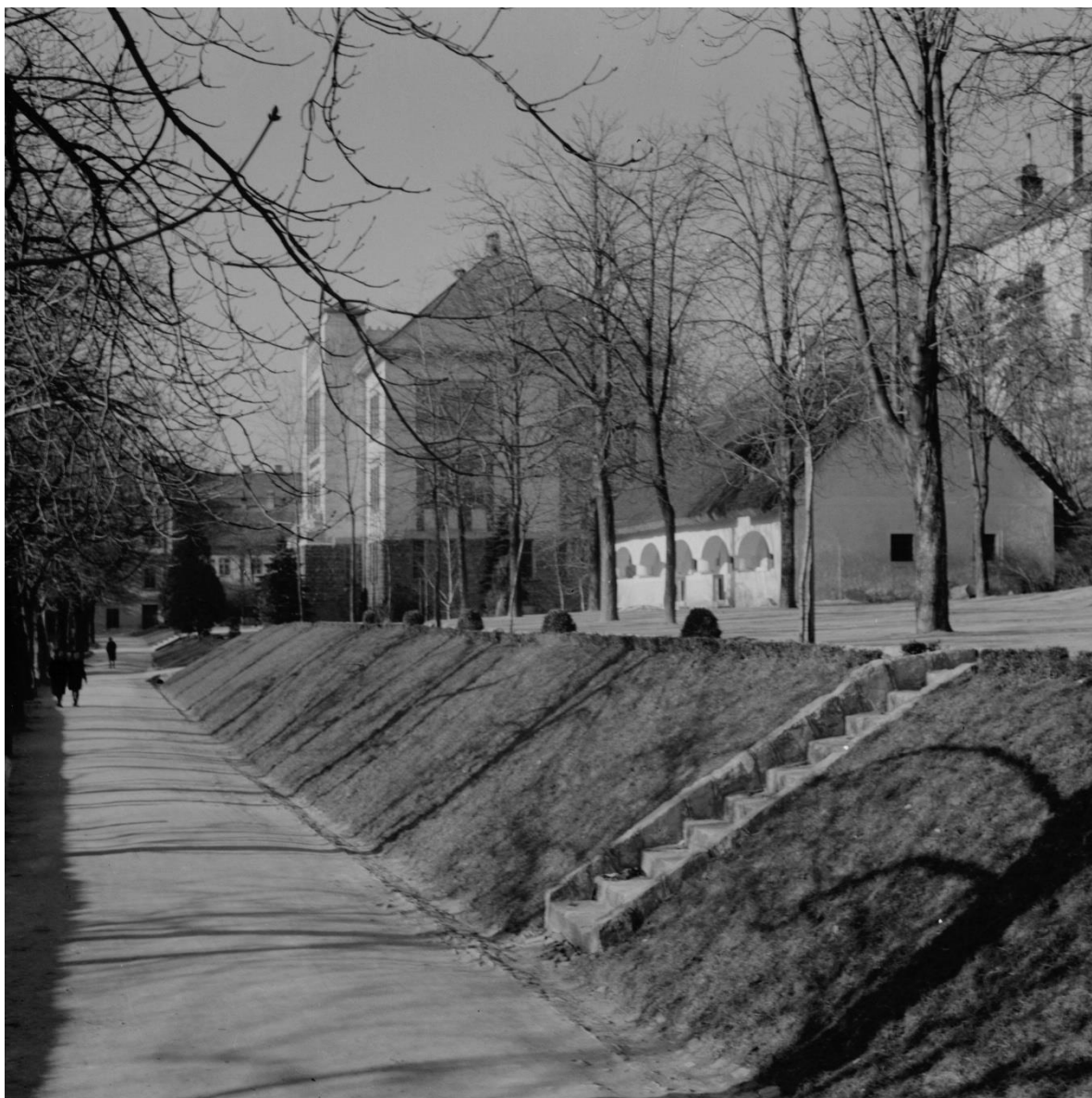
3111 Bakonyi ház 1942