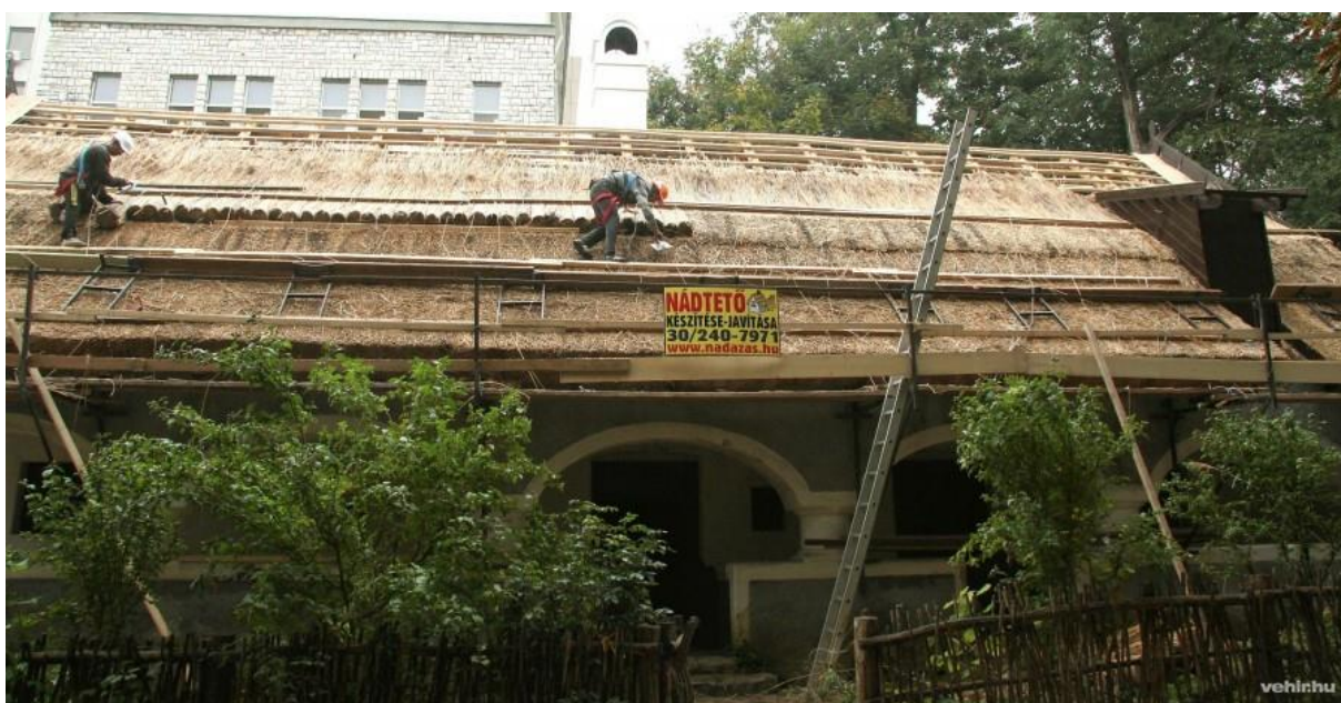
Bakonyi Ház felújítás 2014.okt.02.