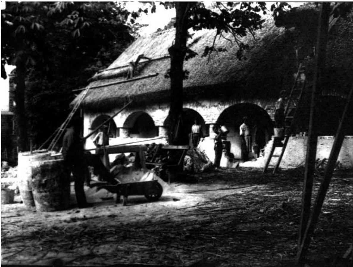
LDM_Fotótár_V.12603 A Bakonyi ház építése 1935

1. Az értéktárba felvételre javasolt nemzeti érték fényképe vagy audiovizuális dokumentációja