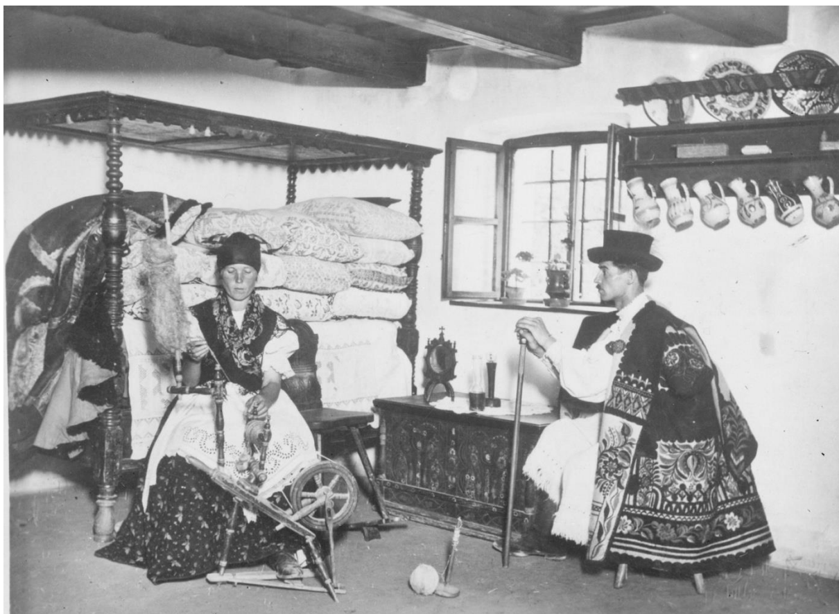
LDM_Fotótár_753 A Bakonyi ház hátsó szobája 1937