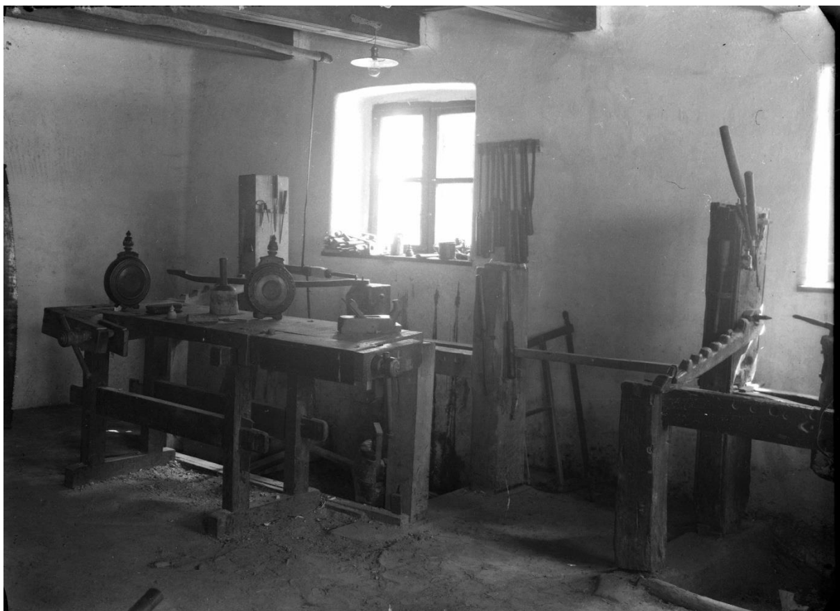
LDM_Fotótár_N.7826 Bakonyi ház hátsó szoba 1937