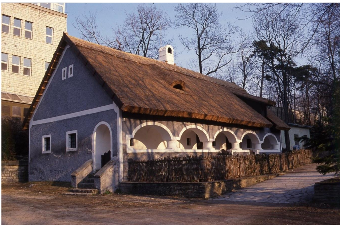
LDM Fotótár D.18306 Bakonyi ház 1999