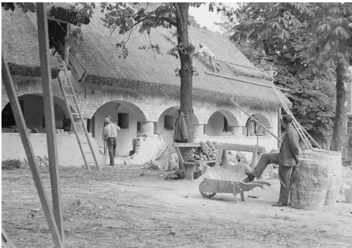
LDM_Fotótár_1346 A Bakonyi ház építése 1935