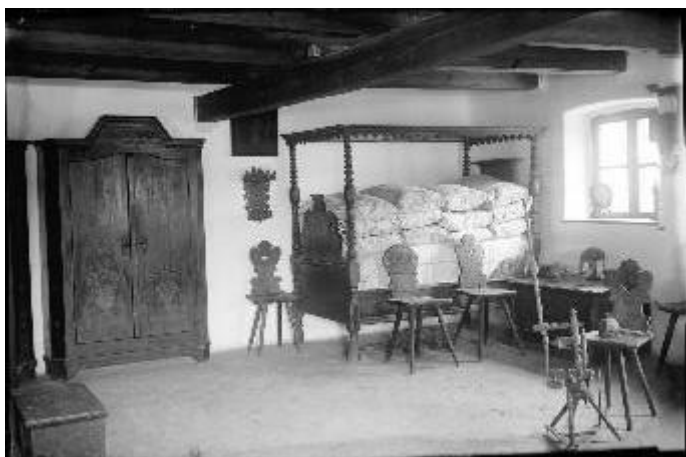
LDM Fotótár_2744 Bakonyi ház hátsó szobája 1940