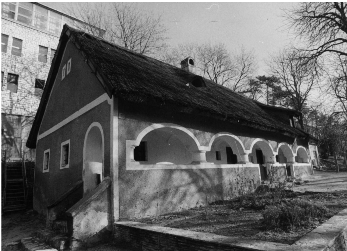
83.119 Bakonyi ház 1982