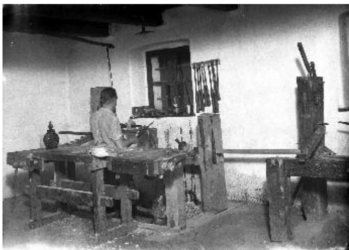
LDM_Fotótár_N.3614 Bakonyi ház hátsó szoba 1937