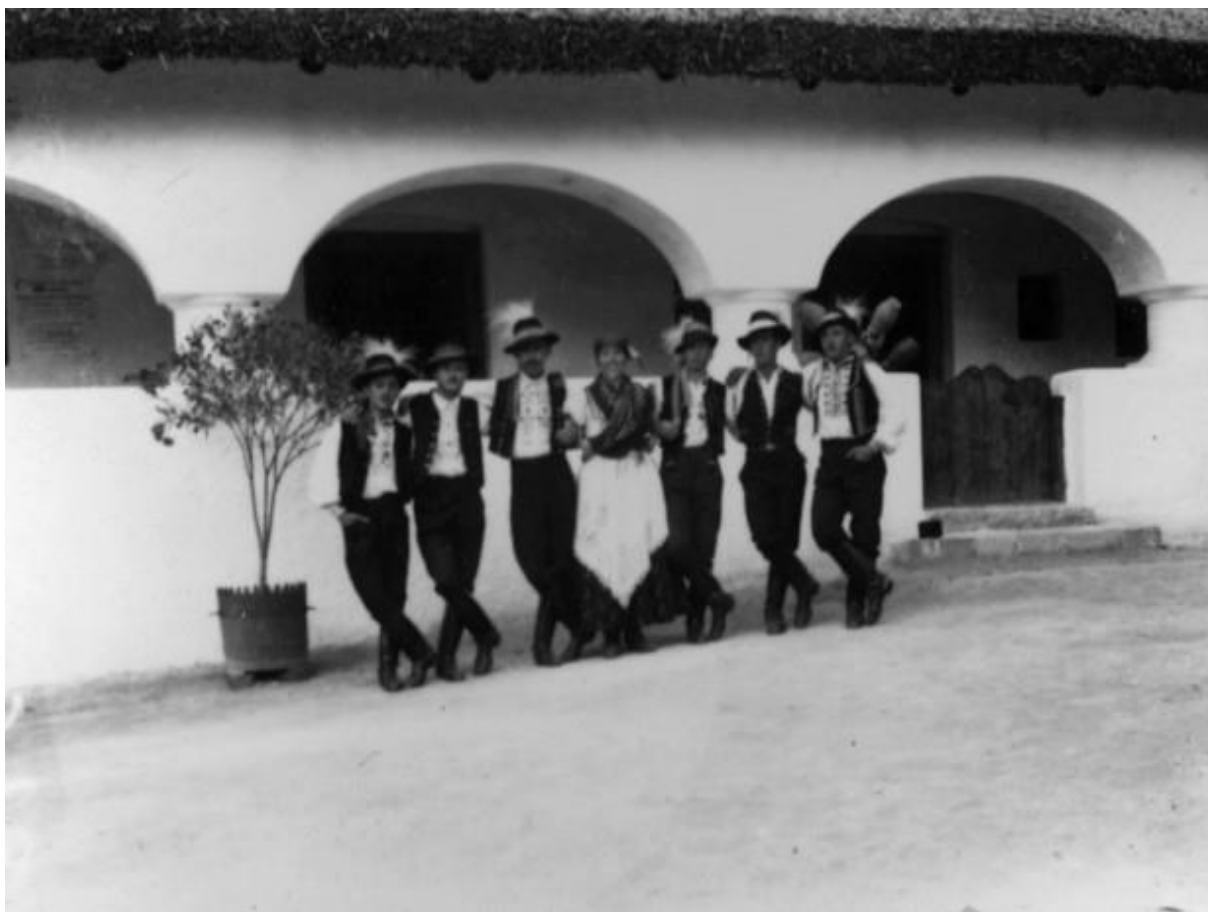
LDM_Fotótár_ N.6024 Bakonyi ház előtt a Siófoki táncsoport 1938