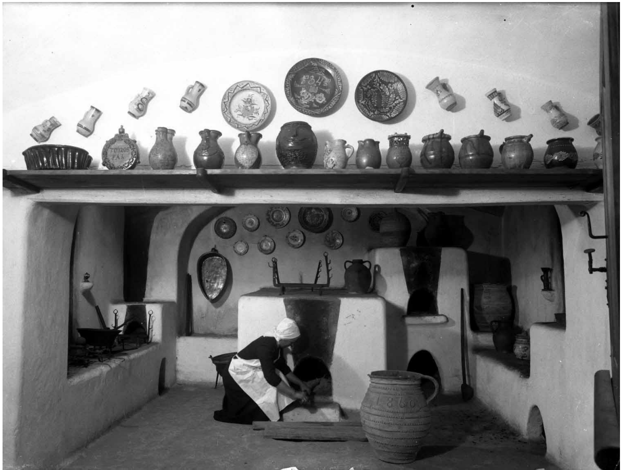
LDM_Fotótár_N.3690 A Bakonyi ház konyhája 1937