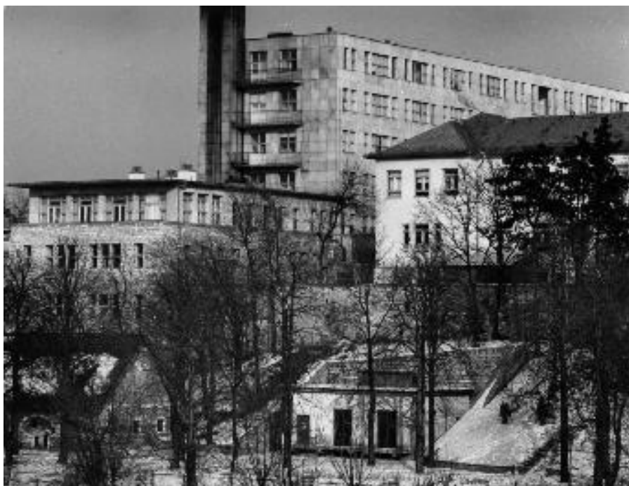
LDM Fotótár 68.7.13. Bakonyi ház 1967