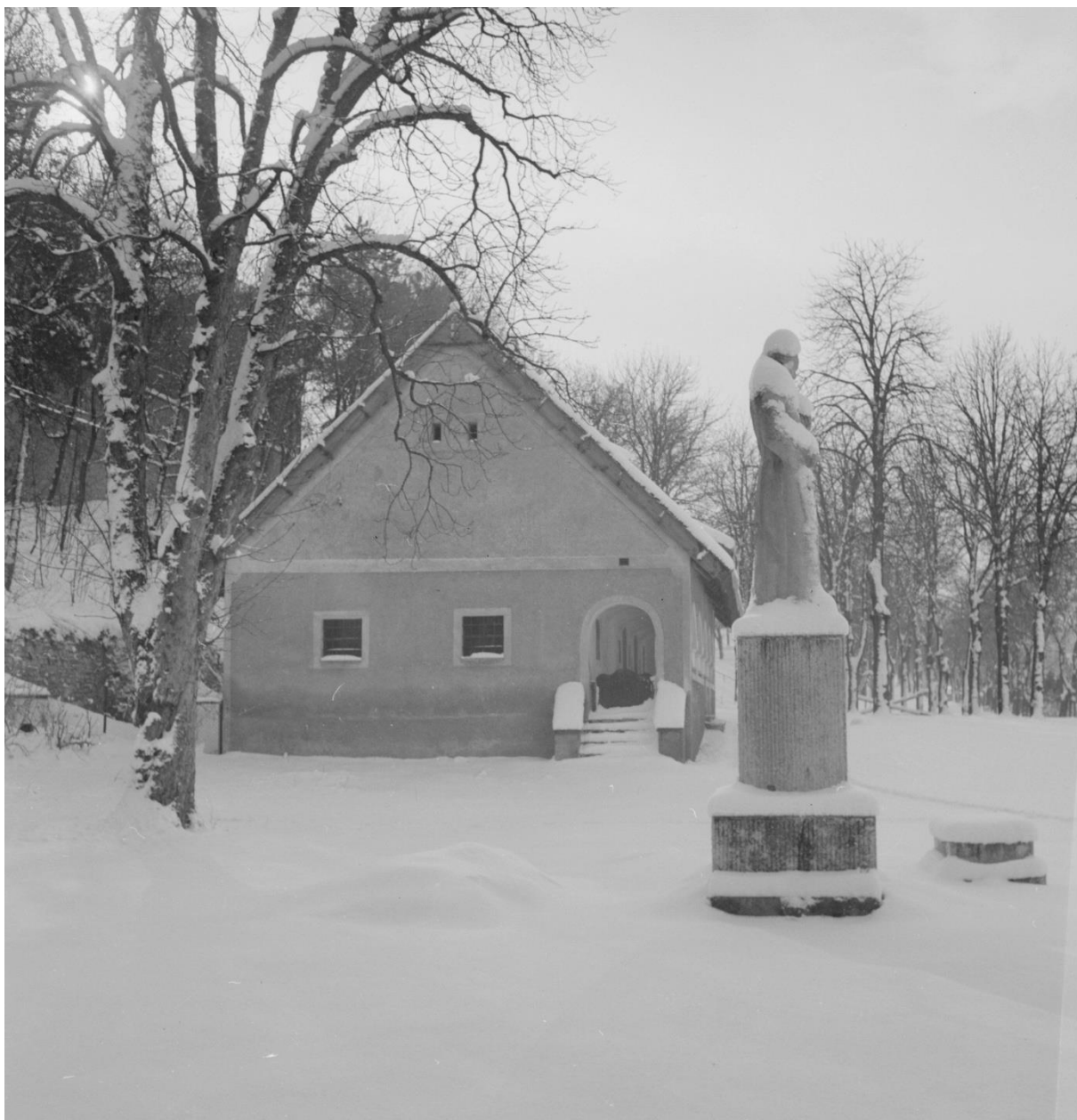
LDM Fotótár 8781 Bakonyi ház 1955