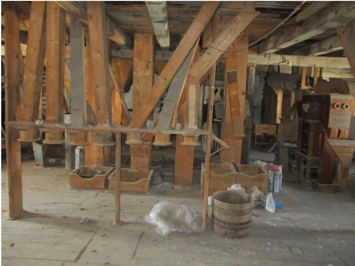
2019 tavasza, a megvásárláskori állapot