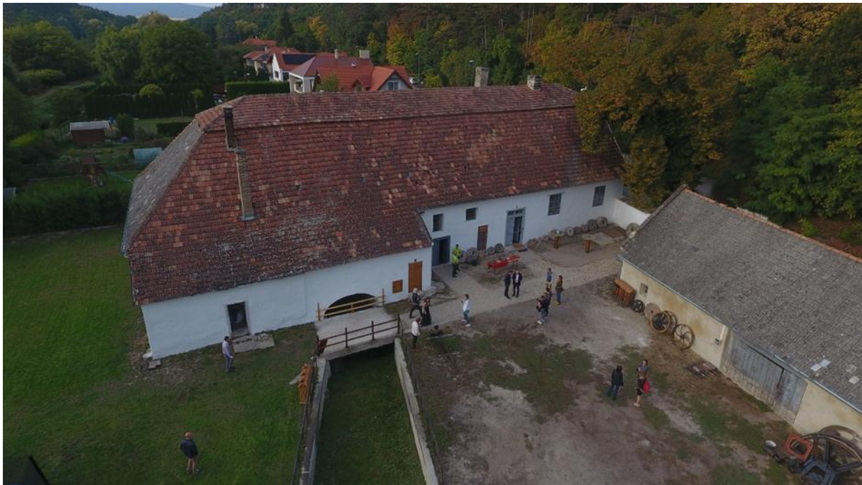
2021 október 1. a felújítás után