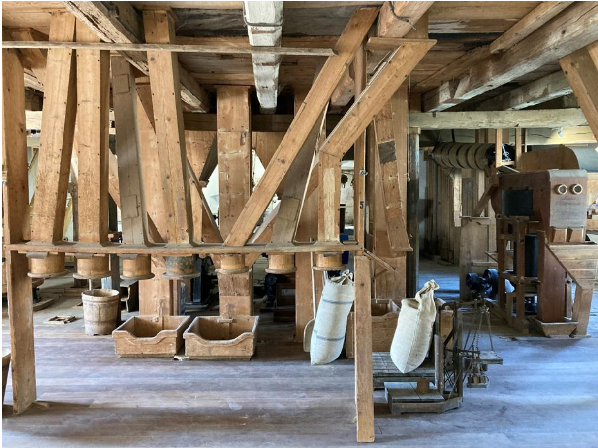
2021. október 1. a felújított malom az eredeti malomgépészettel