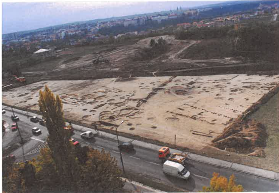
Neolitikus telep feltárása 2003-ban a Jutasi út mellett