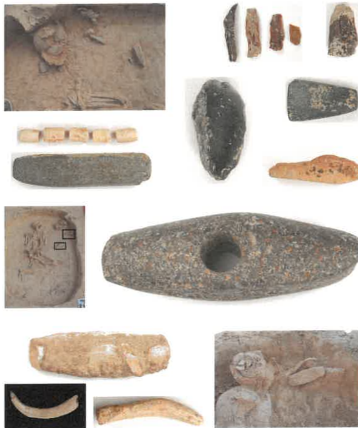
Az alapító sírja a Jutasi úti feltáráson