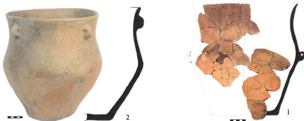
Leletek a feltárásból