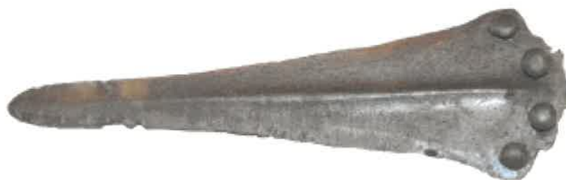
Bronzkori tőr a rendőrség környékéről

A Htv. 1. § (1) bekezdés m ) pontjának való megfelelést valószínűsítő dokumentumok, támogató és ajánló levelek