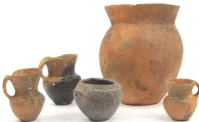
Bronzkori leletek a Thököly utcából