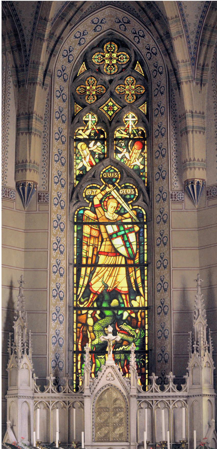
A főoltár mögötti középső üvegablak