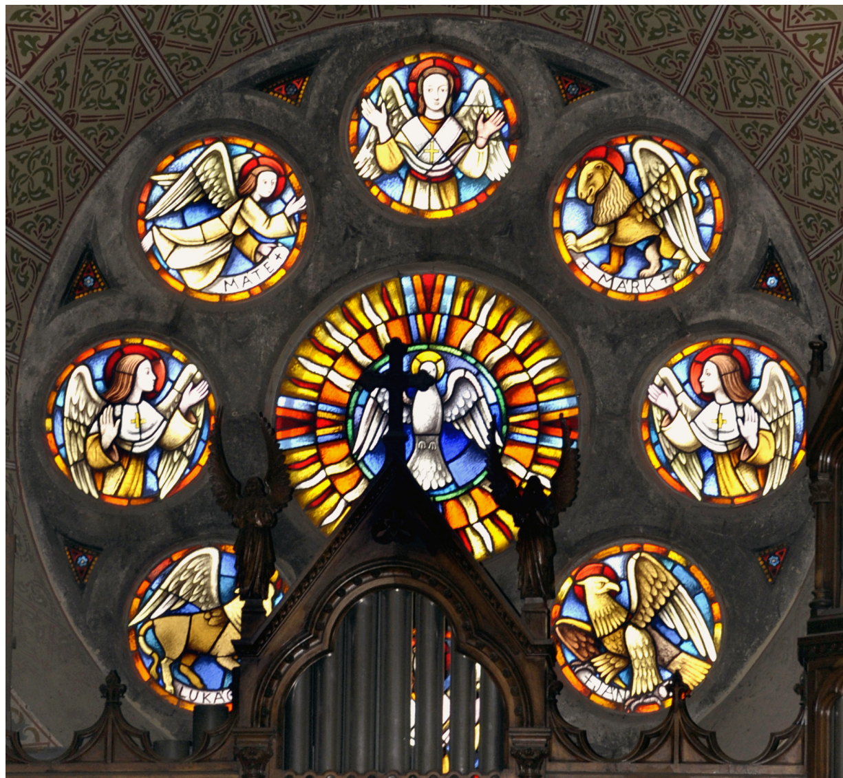
A főbejárat feletti (kórus) körablakok