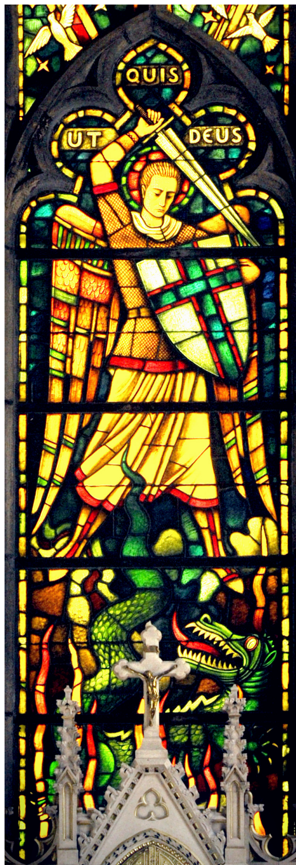
Szent Mihály alakja a főoltár mögötti üvegablakon