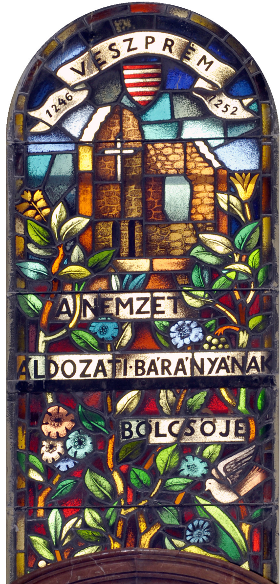
A gyóntatószék feletti üvegablakok