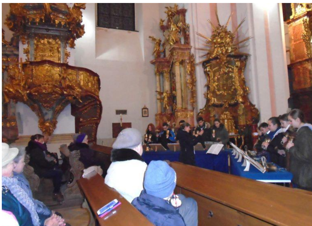
A Szilágyi Harangegyüttes lélekemelő élményt nyújtott a ciszterci bazilikában.