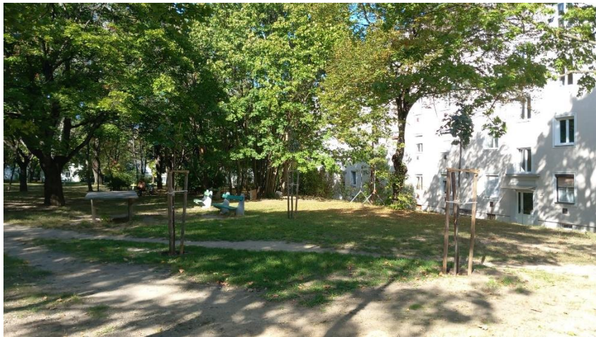
Fásítás a Csermák u. parkoló mentén