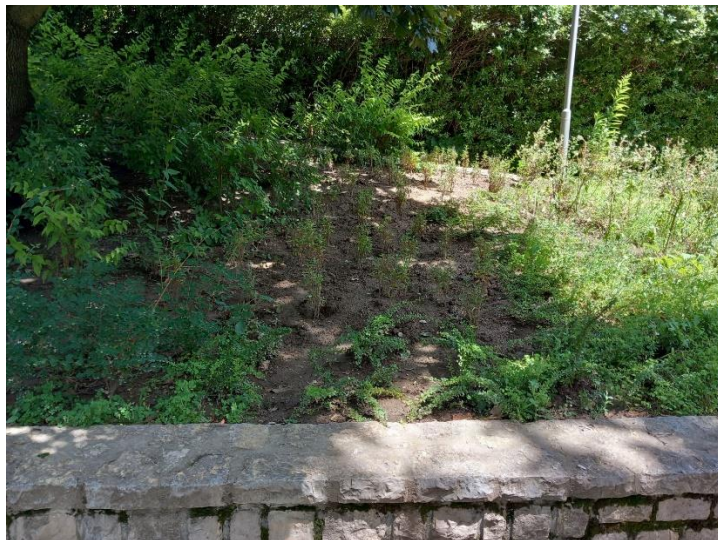
Úrkút sétány cserjetelepítés