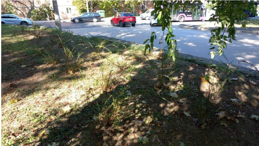
Cserjetelepítés a Stadion u. 6. játszótér mellett