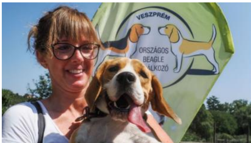
Augusztus 26. Beagle Találkozó