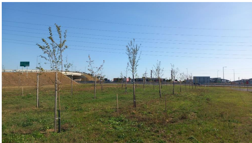
Fásítás a 8-as út Almádi úti csomópontja mellett