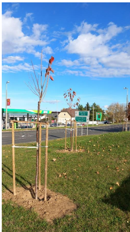
Budapest úti fásítás