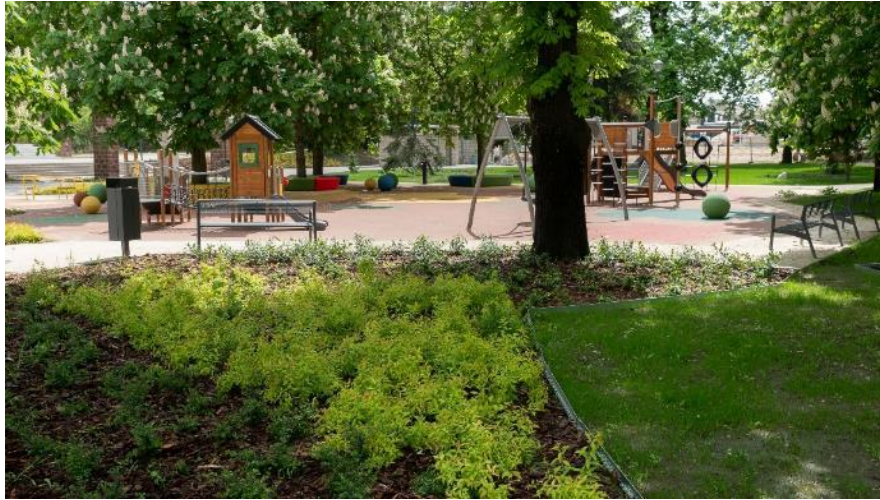
Cserjeültetés részlet, Zöld Város projekt