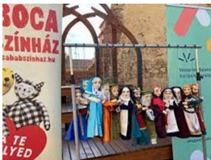
Június 7. Szent Margit bábelőadás, Margit romok