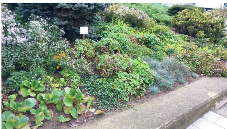
Növénypótlás a Kossuth u. részében