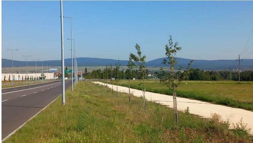
Fásítás részlete a 8-as és 82-es út közötti átvezetés mentén