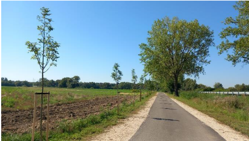
Fásítás részlete a Gyulafirátótra vezető kerékpárút mentén