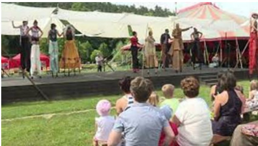
Július 28-30. Kabóciádé