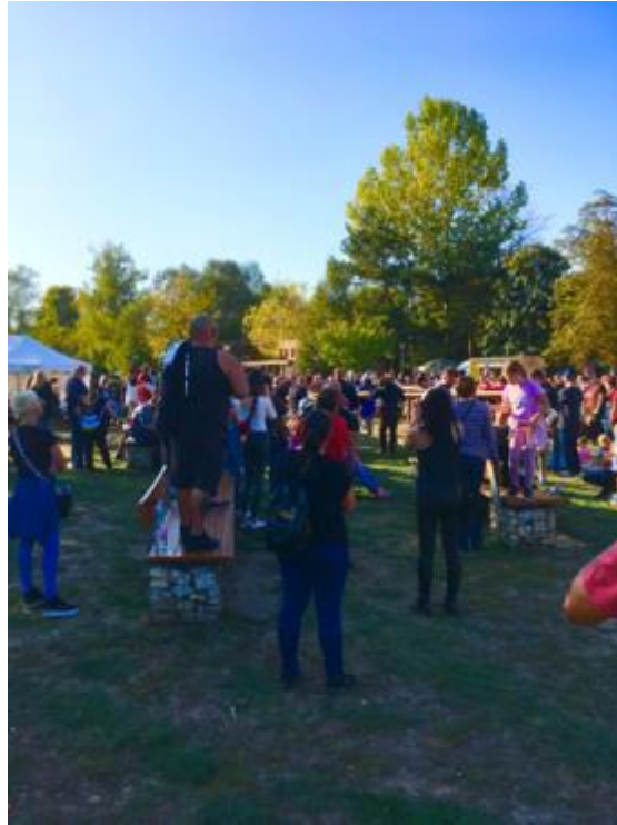
Október 14. Buhurt harcosok