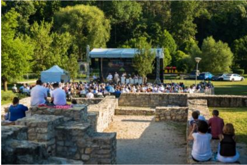
Július 12-16. VeszprémFest