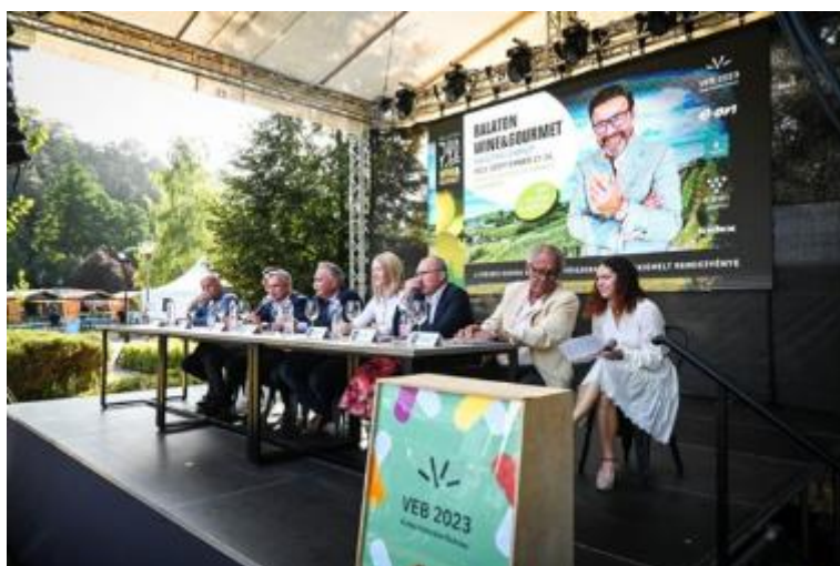
Szeptember 21-24. Balaton Wine & Gourmet