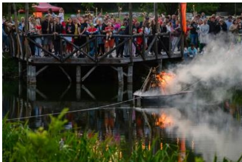
Június 24. Juhannus nap