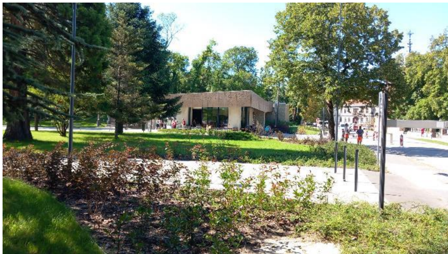
Cserjeültetés részlet, Zöld Város projekt