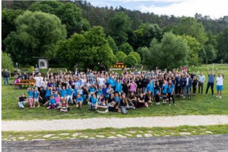
Június 14. Röplabda évfáró