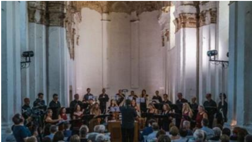
Július 18-29. Veszprémi Régizenei Napok