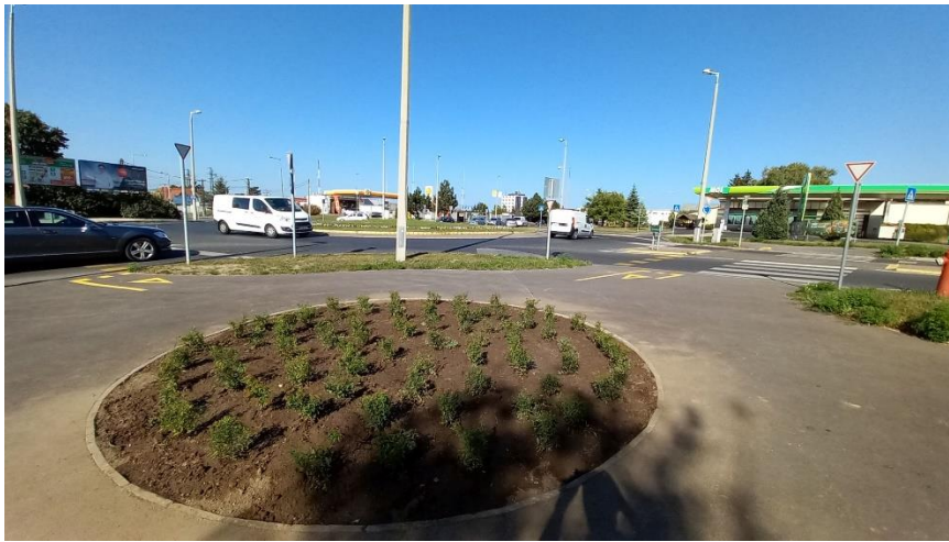
Cserjetelepítés az Almádi úti „kerékpáros körforgalom”-nál