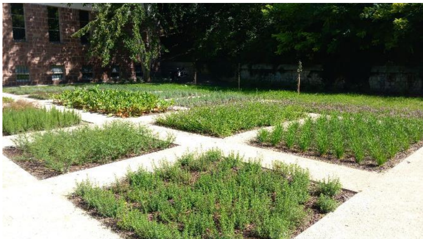
Etnobotanikus kert részlete, Zöld Város projekt