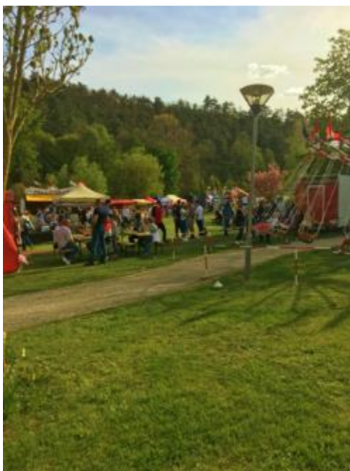
Május 1. Majális