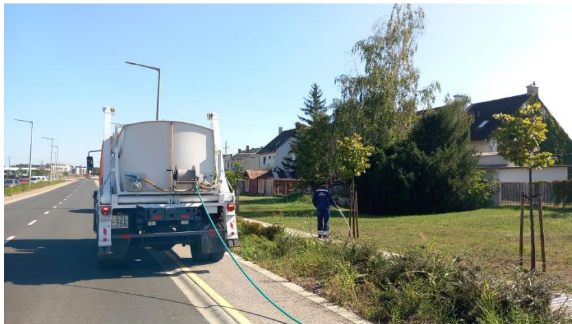
Fák öntözése a Kelet-Nyugati tengely mentén