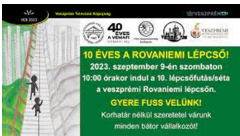
Szeptember 9. Vemafin lépcső futás