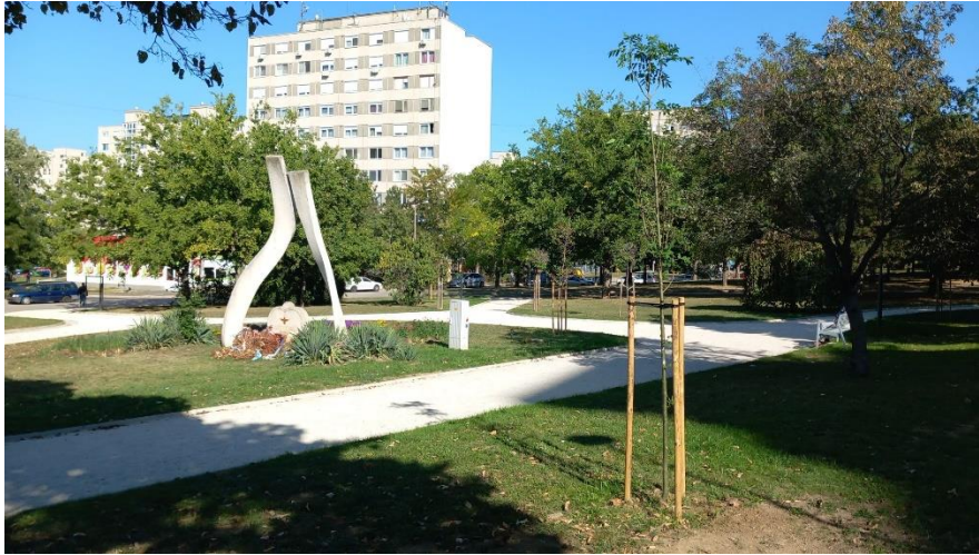
Fásítás a Táborállás parkban