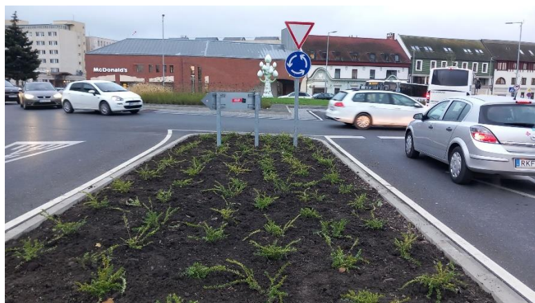
Budapest úti cserjeágy rendezése