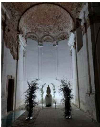
Március 19. Spirituális nap, Jezsuita templom