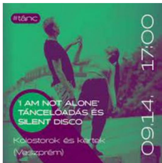
Szeptember 14. InterUrbán: Brno-I am not alone-táncelőadás