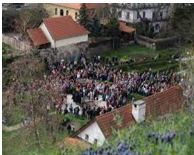
Április 2. Élő Passió