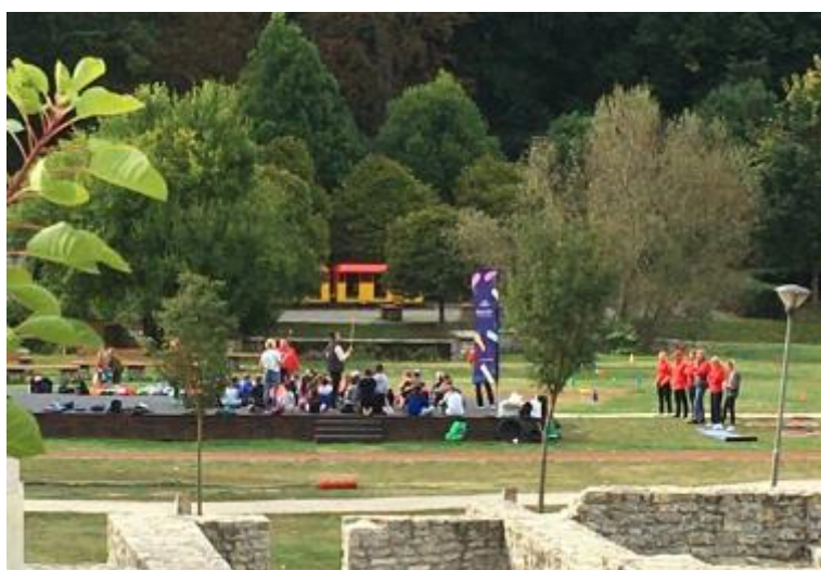
Október 3-10-17-28. VEDAC futás