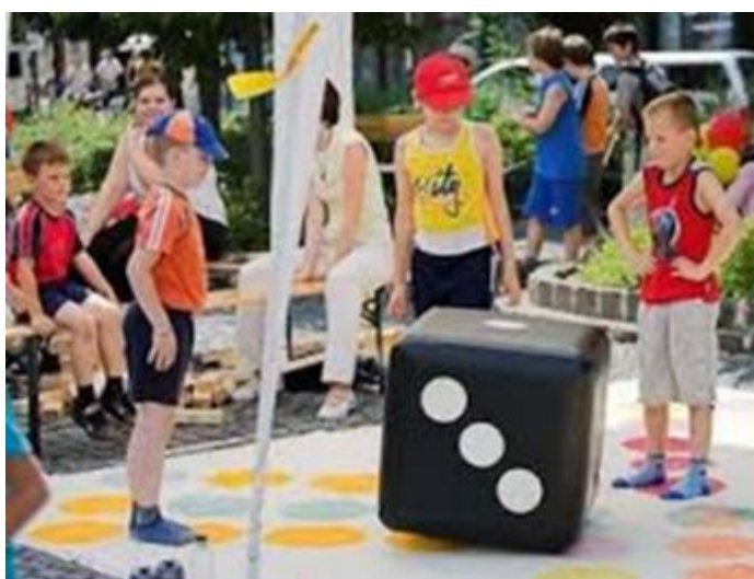
Június 7. Fergeteg Fesztivál