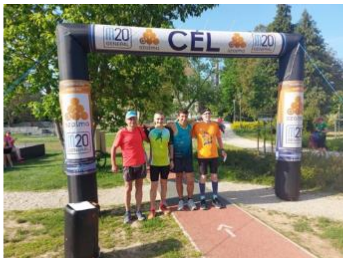
Május 27. Futókörök Napja