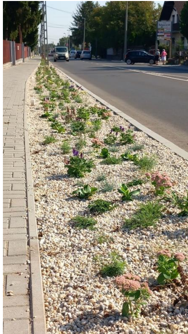
Évelőágy részlete a Budapest út mentén