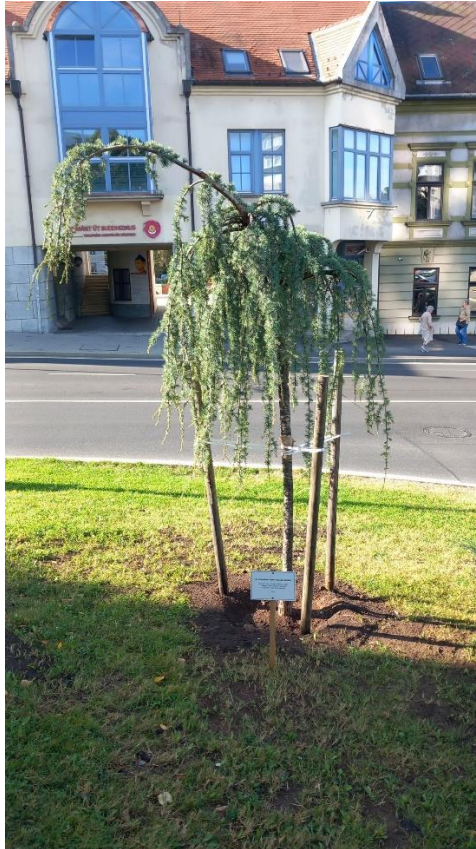
Mazsike emlékfa a Zsidó Kapunál