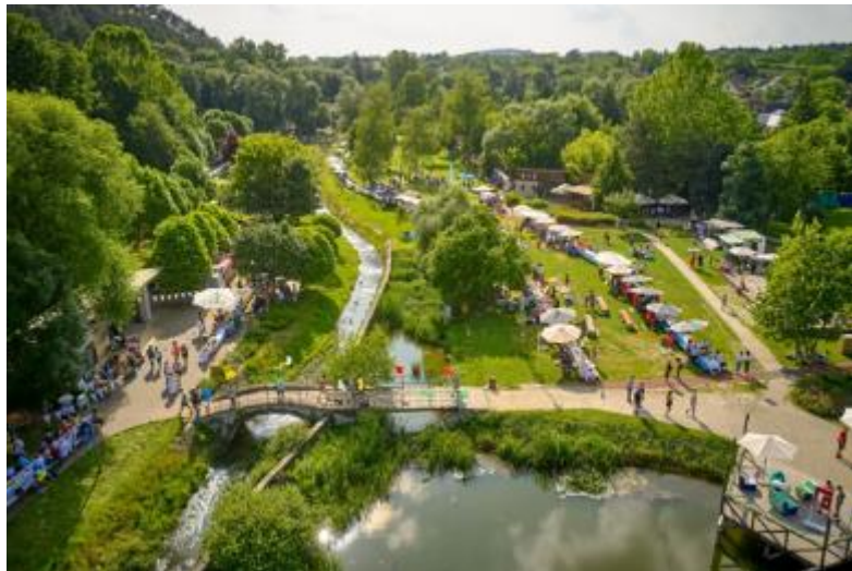
Június 18. Hosszúasztal Piknik