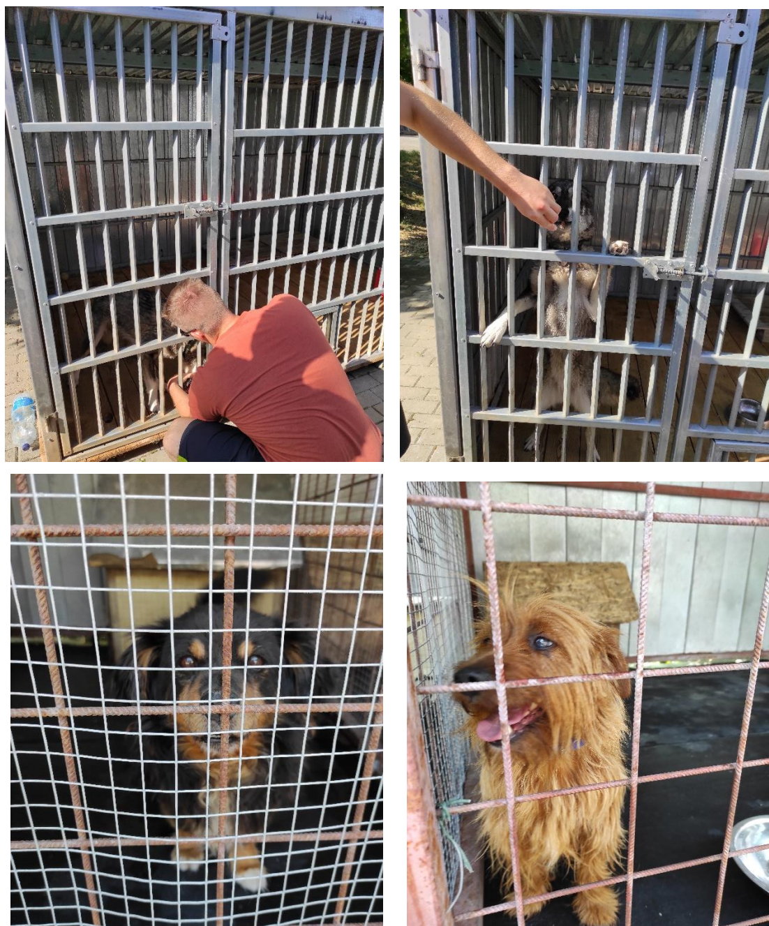
2. ábra: Fényképek a gyepmesteri telep lakóiról

Irodakonténer került megvásárlásra a telepőr számára, szociális helyiséggel ellátva. Megépült egy zárt konténertároló, a telep infrastruktúrája a hatályos állat egészségügyi előírásoknak megfelel.