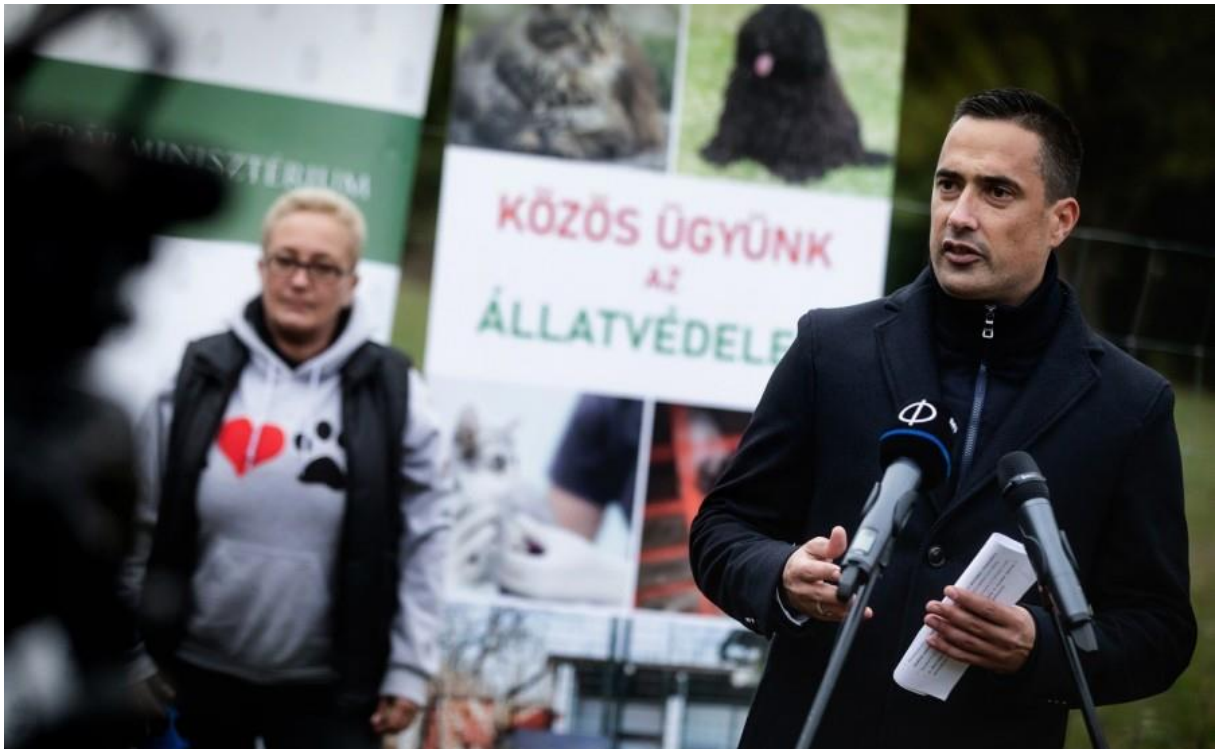
6. ábra Ovádi Péter, a Nemzeti Állatvédelmi Program megújításáért és végrehajtásáért felelős miniszteri biztos

Így miniszteri biztosi kinevezése elején is volt már rálátása azokra a problémákra, megoldásra váró feladatokra, amelyekért most egy személyben ő lett a felelős.