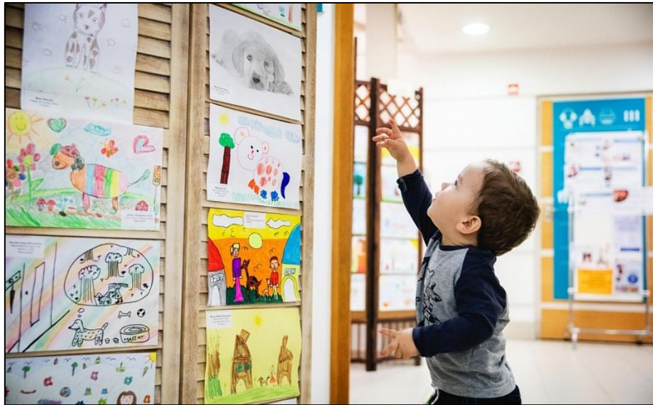
5. ábra: Megyei könyvtár Kis galériájában kiállított pályaművek