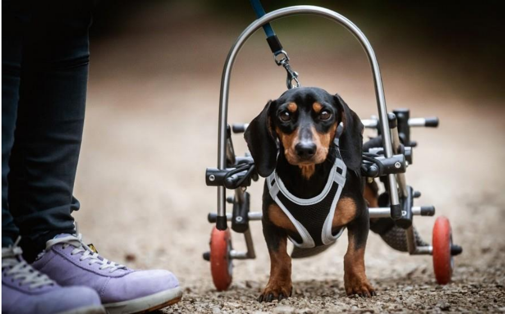
7. ábra: Apród, a kerekesszékes tacskó

Amennyiben a Kormány elfogadja majd a tervezetet, akkor az abban szereplő változtatások egy még állatbarátabb országot, felelősebb magyarországi állattartást hozhatnak el.