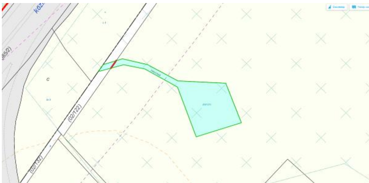
3. Szabályozási Terv részlet

övezete: Magyarország és egyes kiemelt térségeinek területrendezési tervéről szóló 2018. évi CXXXIX. törvény Második Részében foglalt Országos Területrendezési Tervben (OTrT-ben) megállapított, kiemelt térségi és megyei területrendezési tervben alkalmazott övezet, amelybe olyan területek – többnyire lineáris kiterjedésű, folytonos vagy megszakított élőhelyek, élőhelysávok, élőhelymozaikok, élőhelytöredékek, élőhelyláncolatok – tartoznak, amelyek döntő részben természetes eredetűek, és amelyek alkalmasak az ökológiai hálózathoz tartozó egyéb élőhelyek – magterületek, pufferterületek – közötti biológiai kapcsolatok biztosítására.