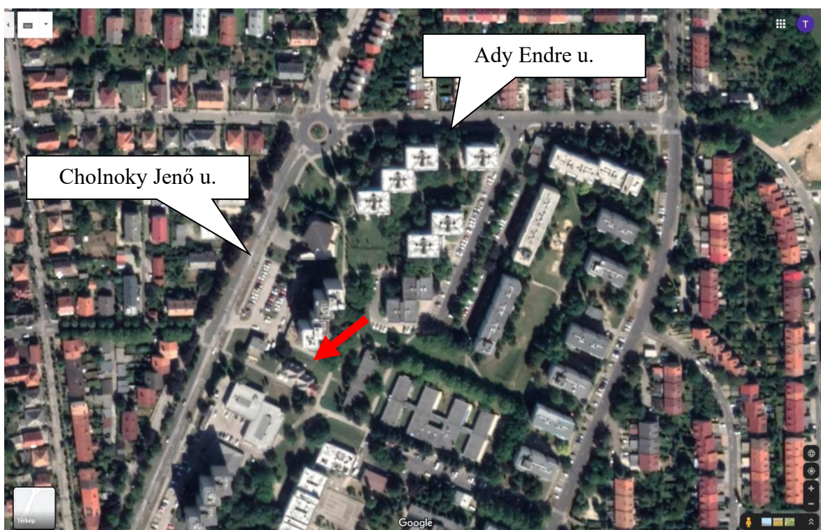
1. ábra: Ingatlan természetbeni elhelyezkedése

Az Ingatlan a település központjától 1,2 km-re délkeletre, a Cholnoky Jenő utcában lévő panelépület lábánál található. Infrastrukturális ellátottsága jó, buszmegálló 150 méterre, oktatási intézmények, egészségügyi és közhivatalok 1,5 km-en belül megtalálhatóak. Az Ingatlan településen belüli elhelyezkedését az alábbi térkép szemlélteti.