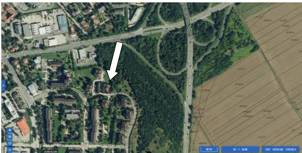
1. Az Ingatlan természetbeni elhelyezkedése

Veszprém Megyei Jogú Város Önkormányzatának (a továbbiakban: Önkormányzat) tulajdonát képezi a Veszprém 4086/92 hrsz.-ú „kivett beépítetlen terület” megnevezésű 6078 m 2 nagyságú – természetben a Sólyi utcában található – ingatlan (a továbbiakban: Ingatlan). Az Ingatlan Veszprém keleti szélén, a Budapest felé vezető 8-as számú főközlekedési út déli oldalán, a Cholnoky városrészen helyezkedik el. Környezetében jellemzően lakóházak, valamint óvoda és különböző szolgáltatók találhatóak.