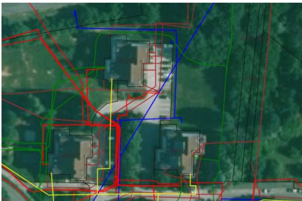
2. Az Ingatlan közműérintettsége

Az Ingatlan mért közművekkel nem rendelkezik, területét ugyanakkor számos közműszolgáltató – a Bakonykarszt Víz- és Csatornamű Zrt., Digi Távközlési és Szolgáltató Kft., E.on Észak-dunántúli Áramhálózati Zrt. – tulajdonában lévő közművezeték érinti.