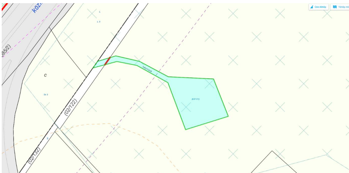
3. Szabályozási Terv részlet

Az Ingatlan "B" és "C" hidrogeológiai védőövezeten belül fekszik. Fentiekén túl Országos ökológiai hálózat Ökológiai folyosó területén helyezkedik el. Ökológiai hálózat ökológiai folyosójának övezete: Magyarország és egyes kiemelt térségeinek területrendezési tervéről szóló 2018. évi CXXXIX. törvény Második Részében foglalt Országos Területrendezési Tervben (OTrT-ben) megállapított, kiemelt térségi és megyei területrendezési tervben alkalmazott övezet, amelybe olyan területek – többnyire lineáris kiterjedésű, folytonos vagy megszakított élőhelyek, élőhelysávok, élőhelymozaikok, élőhelytöredékek, élőhelyláncolatok – tartoznak, amelyek döntő részben természetes eredetűek, és amelyek alkalmasak az ökológiai hálózathoz tartozó egyéb élőhelyek – magterületek, pufferterületek – közötti biológiai kapcsolatok biztosítására.