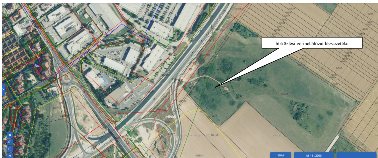
2. Az Ingatlan közműérintettsége

Az Ingatlan mért közművekkel nem rendelkezik, a közelében az MVM NET Zrt. országos hírközlési gerinchálózatának légvezetéke húzódik.