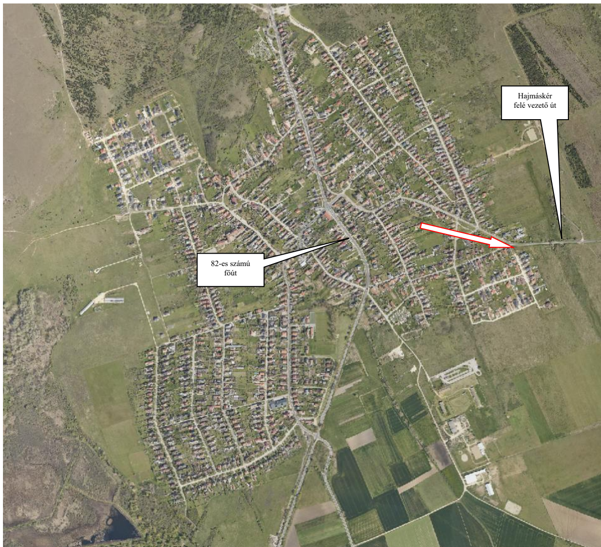
1. ábra: Az Ingatlan településen belüli elhelyezkedése

Az érintett ingatlan Veszprém-Gyulafirátót településrészen helyezkedik el, Veszprém központjától északkeletre. Az Ingatlan közvetlen környezetében beépítetlen területek, lakóházak és mellékút helyezkedik el. Az Ingatlan infrastrukturális ellátottsága közepes. Kereskedelmi-szolgáltató egységek 800 méteren belül, iskola, óvoda, bölcsőde, egészségügyi intézmények 1000 méteren belül megtalálhatóak. A helyközi buszjárat buszmegállója 50 méter távolságra található. Az Ingatlan elhelyezkedése periférikus.