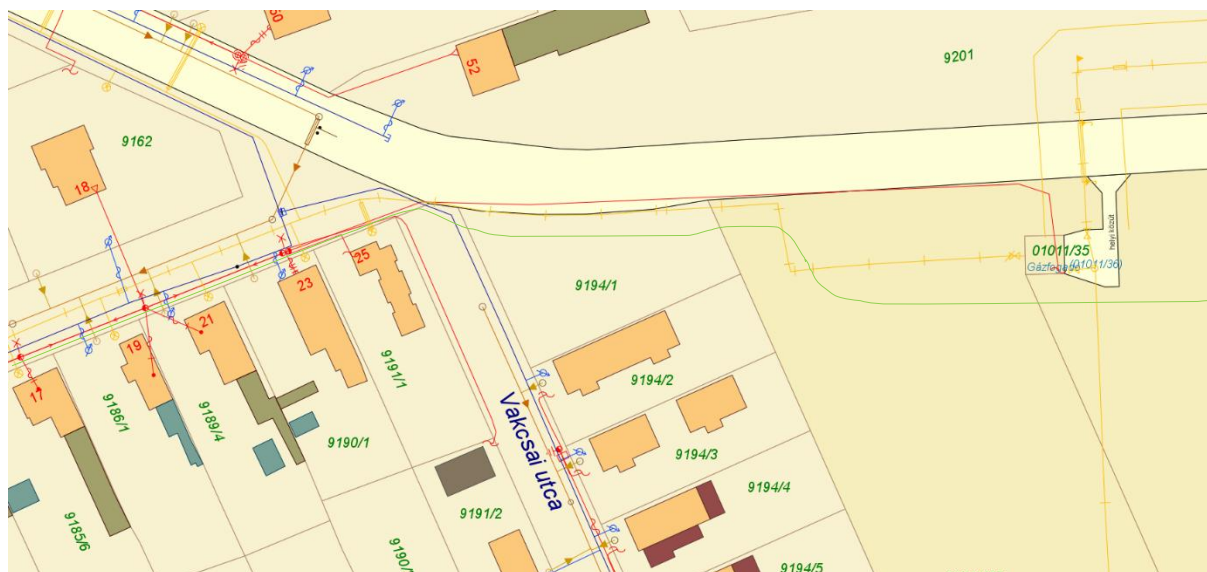
3. ábra: Az Ingatlan közműértettsége

Az Ingatlan nem közművesített, gáz, valamint távközlési vezeték, továbbá villamos vezeték védőövezete érinti. Ebből ingatlan-nyilvántartásba bejegyzett az E-on gázhálózati szolgálat, a többi nyilvántartáson kívüli, rendezetlen kötelelem.