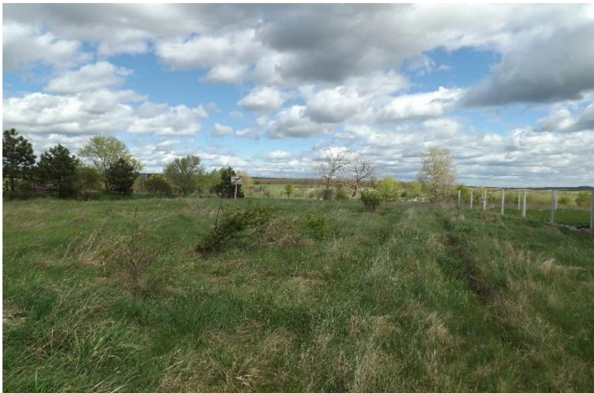
2. ábra: Az Ingatlan természetbeni elhelyezkedése

Az Ingatlan területe északkelet-délnyugat hossz tengelyű, délnyugati irány felé enyhén lejtős, gyepjellegű, lágyszárú vad növényzet borítja. Megközelíthető a Vakcsai utcából aszfaltozott, majd földúton keresztül. Közvetlen közelében a Gyulafirátót-Hajmáskér közötti mellékút halad el. Közterületi kapcsolata a Veszprém belterület 9193 hrsz.-ú ingatlan.